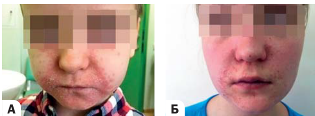
Рис. 2, А, Б. Периоральный розацеаподобный дерматит Fig. 2, А, Б. Perioral rosacea-like dermatitis

Пимекролимус в виде 1% крема имеет преимущества по сравнению с тГКС, т. к. не вызывает побочных эффектов и может быть использован даже при лечении периорального розацеаподобного дерматита [49, 50]. Также при использовании пимекролимуса отсутствует риск развития атрофии кожи, всасывания через кожу и системного влияния; не наблюдается синдрома отмены, характерного для тГКС. В ряде исследований было продемонстрировано, что пимекролимус в виде 1% крема применяется с целью постепенной отмены тГКС при долгосрочном их использовании (метод степ-терапии, step-down ) [49, 51, 52]. Таким образом, пимекролимус является препаратом выбора как стероидсберегающее средство наружного применения, он также может использоваться в качестве местного противовоспалительного средства первой линии на коже лица и в крупных складках кожи [49, 51, 52]. Пимекролимус может использоваться как в случае обострений, так и для снижения риска рецидивов в области ранее пораженной кожи в качестве средства проактивной поддерживающей интермиттирующей терапии [53–55]: так, исследования с участием детей и подростков показали, что длительная проактивная терапия с использованием пимекролимуса снижает риск рецидивов заболевания [56–58].